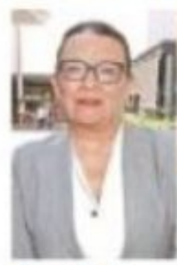
Rosa Icela Rodríguez

==== Conforme avanza el sexenio, algunos funcionarios del gabinete han comenzado a perder el miedo a ser criticados, o regañados, por usar helicópteros para trasladarse de un punto a otro dentro de la Ciudad de México. Ayer, varios