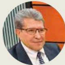
● Ricardo Monreal.