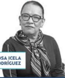
ROSA ICELA RODRÍGUEZ

› Anticipándose a los cambios que puedan surgir en el gobierno de Estados Unidos, en materia migratoria, la secretaria de Gobernación, Rosa Icela Rodríguez , intensificó reuniones y acuerdos con gobernadores fronterizos para mitigar los efectos de posibles deportaciones masivas. Ayer sostuvo un encuentro con los gobernadores de los estados de Baja California, María del Pilar Ávila ; Chihuahua, Maru Campos ; Sonora, Alfonso Durazo ; y Tamaulipas, Américo Villarreal .