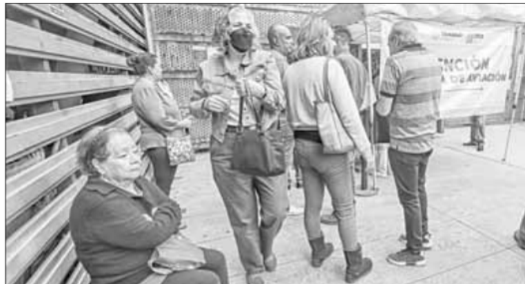
▲ Ex trabajadores de la aerolínea quebrada hace 13 años acudieron ayer por segundo día