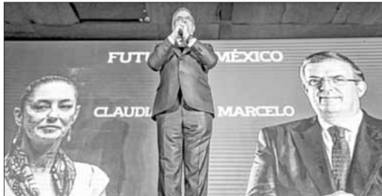
▲ "Dejar a la gente decidir en libertad", pidió ayer Ebrard a Morena, un día antes del sorteo