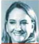
CLAUDIA RUIZ MASSIEU SENADORA DE LA REPÚBLICA @RUIZMASSIEU