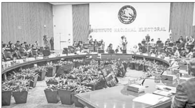
▲ El Consejo General del INE durante una sesión ordinaria.

Twitter: @cafevega cfvmexico_sa@hotmail.com