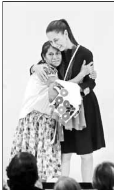
▲ Claudia Sheinbaum, virtual presidenta electa, presentó ayer en el Museo de la Ciudad de México, en el Centro Histórico, su programa de apoyo para mujeres de 60 a 64 años, quienes, destacó, históricamente desempeñan el trabajo de cuidados en las familias sin ninguna remuneración, por lo que recibirán 3 mil pesos bimestrales, y que dará comienzo con integrantes de grupos indígenas.