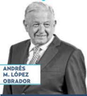
ANDRÉS M. LÓPEZ OBRADOR