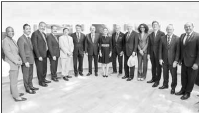
▲ La virtual presidenta electa recibió en la casa de transición, en compañía de su futuro canciller,