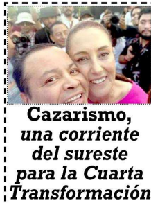
Cazarismo, una corriente del sureste para la Cuarta Transformación!

Presencia Cazarín: Así como el expartido hegemónico PRI confió su operación política con amplios recursos para cambiar el curso de una elección por igual en Tamaulipas, Michoacán, Veracruz, Tabasco, Campeche, Estado de México vía