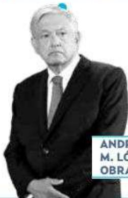
ANDRÉS M. LÓPEZ OBRADOR

› Alicia Bárcena , propuesta del presidente López Obrador como canciller, aprovechó uno de sus últimos actos como embajadora en Chile para informar que el mandatario mexicano visitará ese país sudamericano el 11 de septiembre próximo. El viaje es a invitación del presidente chileno Gabriel Boric para que lo acompañe en la ceremonia conmemorativa del 50 aniversario del Golpe de Estado contra Salvador Allende . Ella, por supuesto, irá con él.