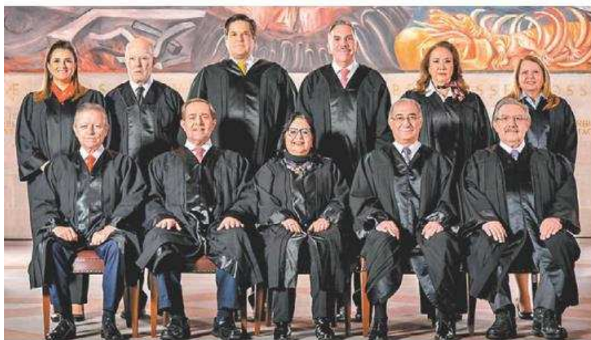
Los ministros del máximo tribunal de justicia del país.