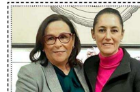
¿En 2024 van Sheinbaum y Nahle?