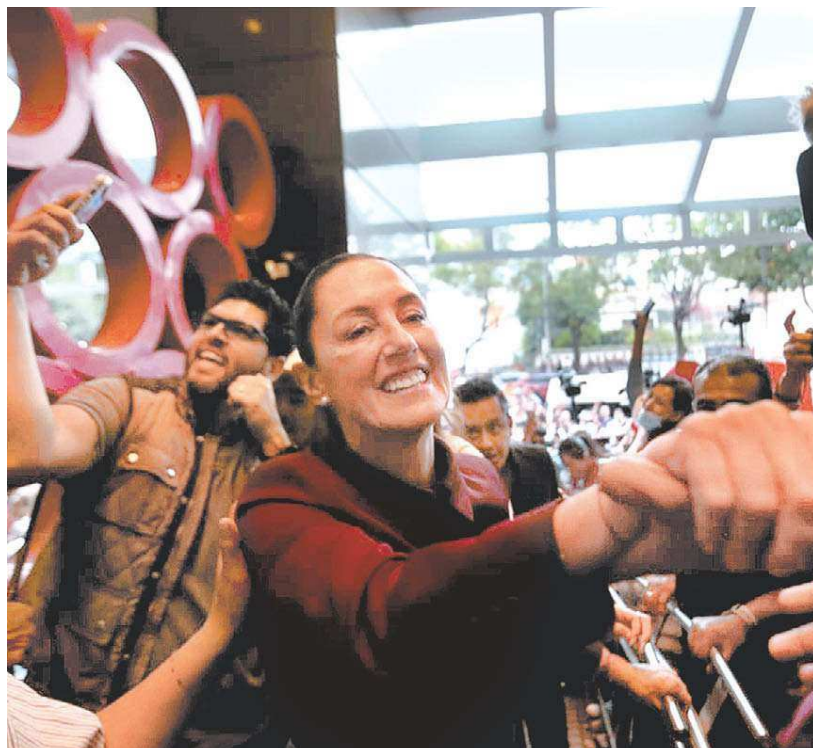
Claudia Sheinbaum a su llegada al hotel sede de Morena para su registro.

Me impongo por tanto la prohibición a guardar silencio o autocensurarme, aunque ello me implique ser acusado de patriarcal, porque de actuar presionado por esa descalificación terminaría ejerciendo una actitud condescendiente y machista que Claudia Sheinbaum no se merece. ■