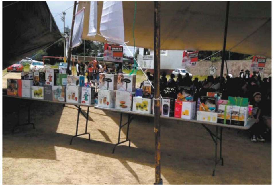
En Acolman se entregaron regalos a cambio de credencial INE.

que me traigan la credencial de elector, que van a votar por Alejandra del Moral”, y a la que pasa le entregan sus enseres domésticos.