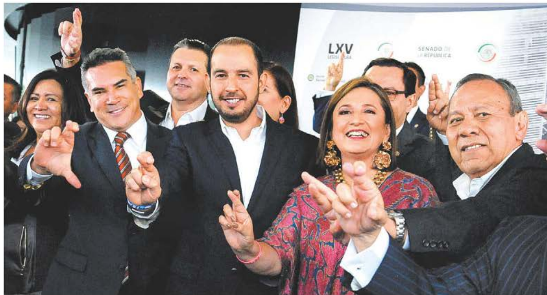
El bloque enfrenta múltiples desafíos para crecer y convertir a su abanderada en una opción competitiva.

No le ayudan nada el tremendo desprestigio de los partidos que integran la alianza, la falta de una estrategia de campaña con mensajes consistentes y la persistente desconexión con las realidades