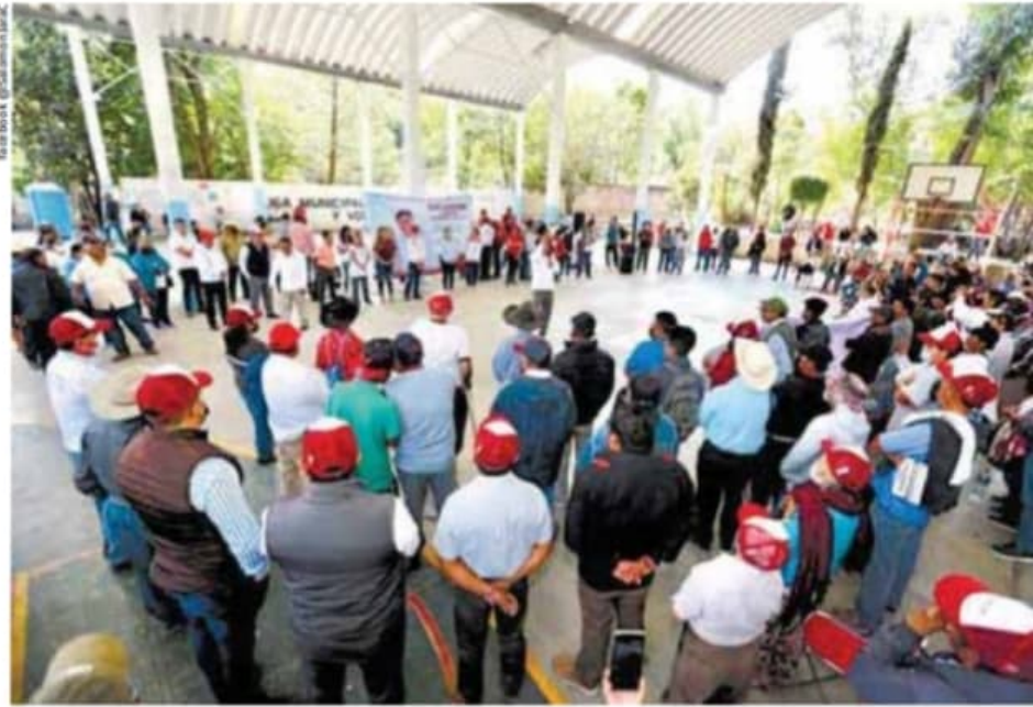
Oaxaca. Apoyo a grupos vulnerables.

Alejandro Avilés Álvarez, candidato del PRI-PRD, sostiene que incrementará los apoyos a los grupos vulnerables: "Habrá el triple de apoyos al campo, a la seguridad, a las mujeres, a los pueblos originarios".