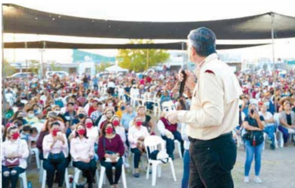
Tamaulipas. Reactivación económica

Al respecto abunda: "Recuperemos el sueño de vivir en un Quintana Roo más seguro, más moderno, reconocido a nivel internacional, pero también un Quintana Roo más humano, más parejo y no con ese México que nos quieren imponer: dividido, asustado, desilusionado y, sobre todo, profundamente lastimado".