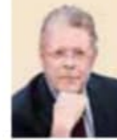
JAQUE MATE Sergio Sarmiento @SergioSarmiento

A l final no fue un ejercicio de revocación de mandato, sino de ratificación. No es lo que decía la ley, la misma Constitución, pero poco o nada importó. El presidente López Obrador demostró una vez más tener el poder para hacer lo que quería con el proceso. Lo convirtió en una plataforma de promoción personal y de fortalecimiento de su movimiento político. Lo hizo también un arma en su campaña para acabar con el INE y el Tribunal Electoral. Ya ha anunciado, de hecho, que una vez terminado el proceso de revocación mandará al Congreso una iniciativa de reforma constitucional para destituir a los actuales consejeros y magistrados y sustituirlos, previo voto popular, con simpatizantes de su movimiento.