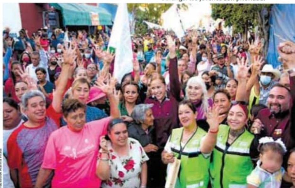
Durango: los jóvenes son prioridad.

"Las únicas excepciones a lo anterior serán las campañas de información de las autoridades electorales, las relativas a servicios educativos y de salud o las necesarias para la protección civil en casos de emergencia".