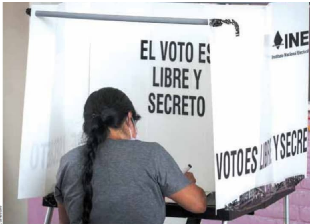
1 de junio cierran campañas.

" Los ciudadanos tendrán la oportunidad de refrendar su apoyo o bien optar por la alternancia".