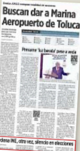
Ordena INE, otra vez, silencio en elecciones

La Comisión de Quejas del INE ordena al Mandatario eliminar o modificar su conferencia del 19 de febrero.