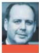
GUSTAVO DE HOYOS PRESIDENTE DEL CNLE @GDEHOYOSWAL- THER