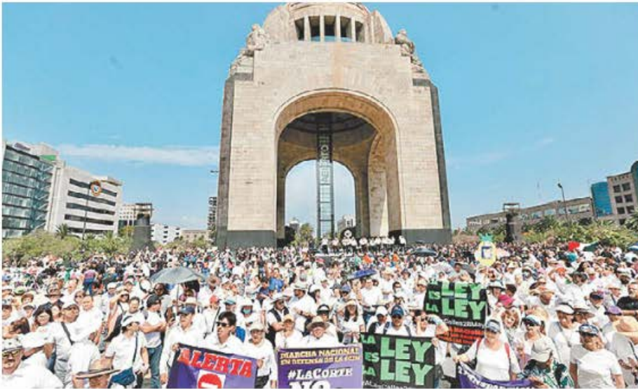
Movilización ciudadana en defensa de la Corte, en mayo de 2023. ARIELOJEDA