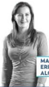
MARTHA ERIKA ALONSO