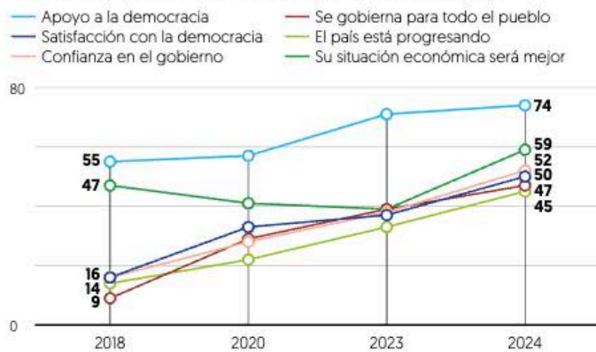
Porcentaje de mexicanos y mexicanas que opina/apoya/confía.