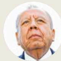
● Francisco Garduño Yáñez

"¿Nada?" "Nada, nada" "¿Nada de nada?" "Nada". Garduño asistió el miércoles como titular del INM a un foro sobre migración organizado por la Secretaría de Gobernación. Expuso cifras sin filtros que deben ser un manjar para los halcones de Washington: de los 16 millones de personas que pasaron por el territorio mexicano entre 2019 y 2024, 10.5 millones "pudieron cruzar el muro". Luego difundió un largo video que exhibe a migrantes violentos que enfrentan los agentes mexicanos, sangre, mutilados, heridos. Supongo que Palacio Nacional no llamó a Garduño para felicitarlo. ¿Cómo está tomando las decisiones migratorias el gobierno? ¿Con Garduño ?