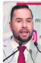
Reyes Galindo Pedraza

:::: Nos platican que el diputado michoacano Reyes Galindo Pedraza aseguró ayer que el narcocontrol de medicinas en Tierra Caliente no llega a todos los rincones de esa región. A pregunta expresa, el legislador petista afirmó que, al menos en la zona que él representa, que tiene cabecera en Múgica y abarca otros siete municipios, "no hay reporte de monopolio ilegal de medicamentos por parte del crimen organizado". El diputado aseguró que en esa zona hay presencia permanente de elementos de seguridad. No está claro si los lugareños opinan lo mismo o es que don Reyes aplica el viejo truco de que si no hay denuncia no hay delito.