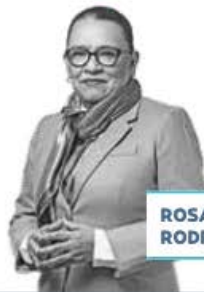
ROSA ICELA RODRÍGUEZ

► Reunión binacional de alto nivel se realizará en Washington este jueves. El objetivo es revisar temas de seguridad, en particular lo concerniente en migración. La delegación mexicana la encabeza la secretaria de Seguridad y Protección Ciudadana, Rosa Icela Rodríguez Velázquez . La acompañarán, entre otros, los titulares de la Secretaría de la Defensa Nacional (Sedena), Luis Cresencio Sandoval ; y de la Secretaría de Marina (Semar), Rafael Ojeda Durán .