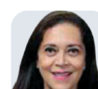
ADRIANA FAVELA Ex consejera del INE CARGO AL QUE ASPIRA: Ministra de la SCJN