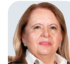
LORETTA ORTIZ AHLF Ministras de la SCJN CARGO AL QUE ASPIRA: Ministra de la SCJN