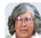
MARÍA ESTELA RÍOS Ex consejera jurídica en el Gobierno de AMLO CARGO AL QUE ASPIRA: Ministra de la SCJN