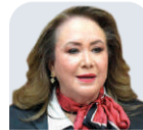
YASMÍN ESQUIVEL MOSSA Ministras de la SCJN CARGO AL QUE ASPIRA: Ministra de la SCJN