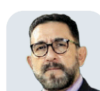
ULISES LARA Actual encargado de despacho de la FGJ de la CDMX CARGO AL QUE ASPIRA: Magistrado de Circuito