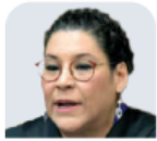
LENIA BATRES GUADARRAMA Ministra de la SCJN CARGO AL QUE ASPIRA: Ministra de la SCJN