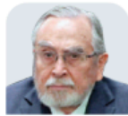
BERNARDO BÁTIZ Consejero de la Judicatura CARGO AL QUE ASPIRA: Ministro de la SCJN