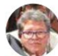
● Ricardo Monreal, senador de Morena.

Monreal se apejó a sus principios, su cercanía al movimiento del Presidente no invalida su trabajo legislativo.