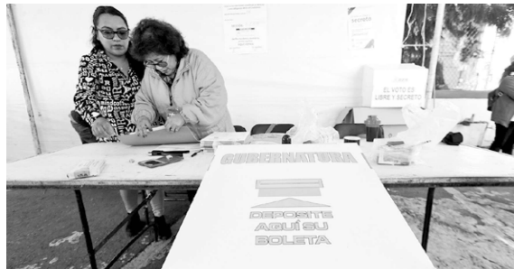
Casillas de Votaciones en el Estado de México.

Dijo además que el presupuesto solicitado por el IEEM se encuentra dentro de los parámetros de otros organismos electorales y es menor el gasto previsto por elector en el estado. Ejemplo es Colima y Baja California Sur, donde se contempla una erogación por elector 20 y 48% respectivamente, más elevada que en el Estado de México.