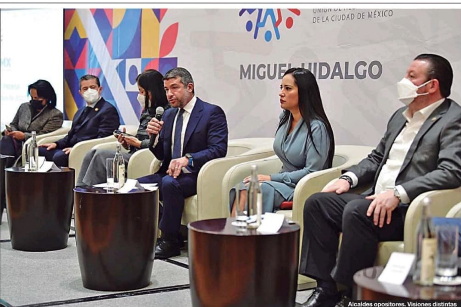
Alcaldes opositores. Visiones distintas

rez. La intención de tener una sola imagen de sistema de seguridad tampoco se logró. Álvaro Obregón, Azcapotzalco, Miguel Hidalgo y Tlalpan copiaron el modelo "Blindar Benito Juárez", instaurado ahí desde el trienio pasado. Pero en Coyoacán, Cuajimalpa y Magdalena Contreras se llama "Escudo".