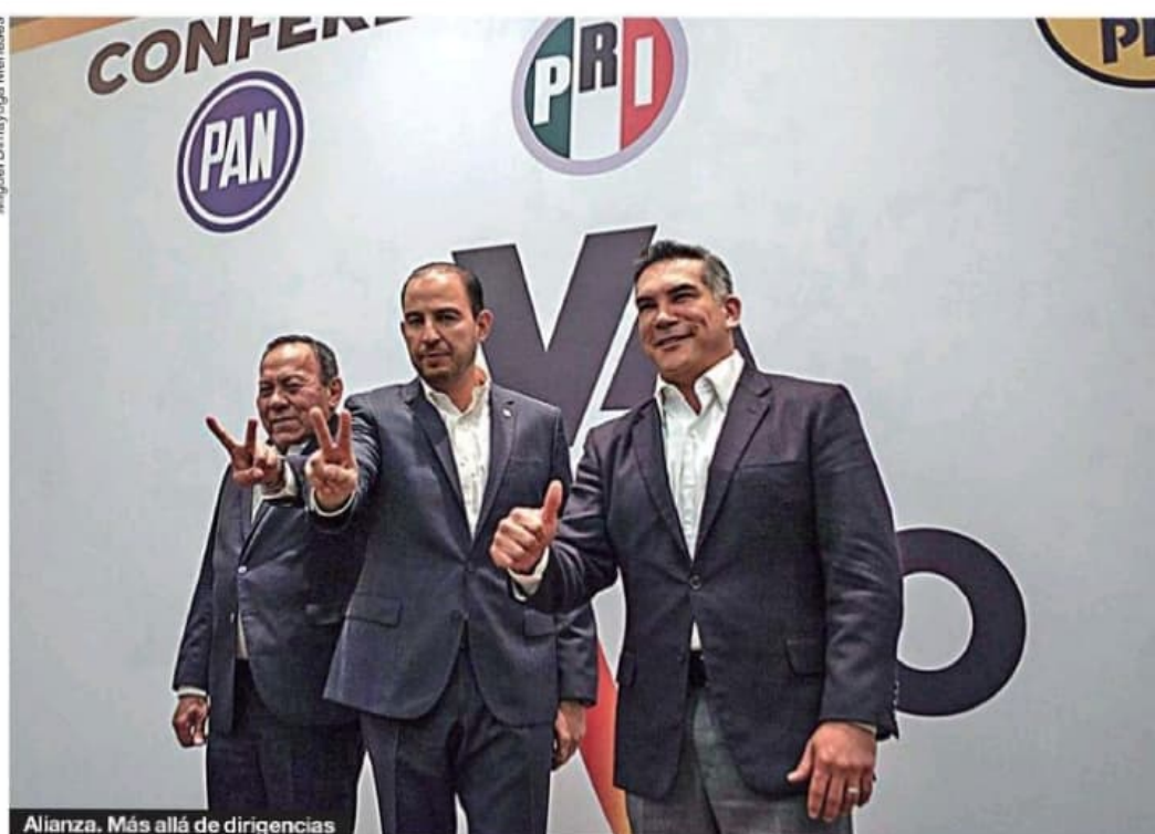
Alianza. Más allá de dirigencias

asumió la dirigencia Alejandro Moreno en 2019 y la salida de miles de sus simpatizantes y militantes que se fueron a Morena, sostiene las apreciaciones de la debilidad de los partidos de oposición.