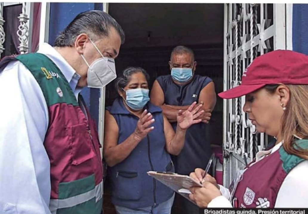
Brigadistas guinda. Presión territorial

En definitiva, dice, "la unión sigue viva", pero "un buen diálogo con la ciudad ayuda a traer buenos resultados a la alcaldía; un buen pleito entorpece".