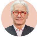
POR JAVIER SOLÓRZANO ZINSER

solorzano52mx@ yahoo.com.mx @JavierSolorzano