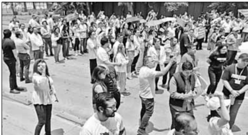
▲ Paro de trabajadores del Poder Judicial de la Federación en Jalisco.