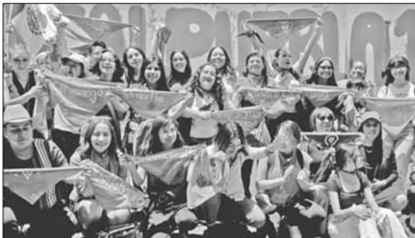
▲ Puebla se convirtió ayer en la entidad número 14 en aprobar la interrupción legal del embarazo hasta la semana 12 de gestación. Grupos pro vida y feministas se