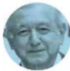
ANDRÉS M. LÓPEZ O.

► Por cierto, se descartó Beatriz Gutiérrez Müller para formar parte del gabinete de Sheinbaum . La esposa del presidente López Obrador respondió a usuarios de redes sociales que le pedían ser la próxima secretaria de Cultura, con un rotundo "no, no". Lo que sí ocurrirá, nos dicen, es que mantendrá la cercana amistad con la próxima presidenta.