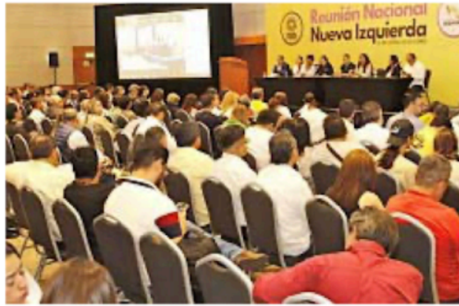
Asistentes se unieron a la iniciativa de crear un nuevo partido de izquierda con los votos obtenidos por el PRD en estados.

Más las deficiencias del partido y el efecto de lo que, aseguró, fue una elección de Estado, llevó a la inminente