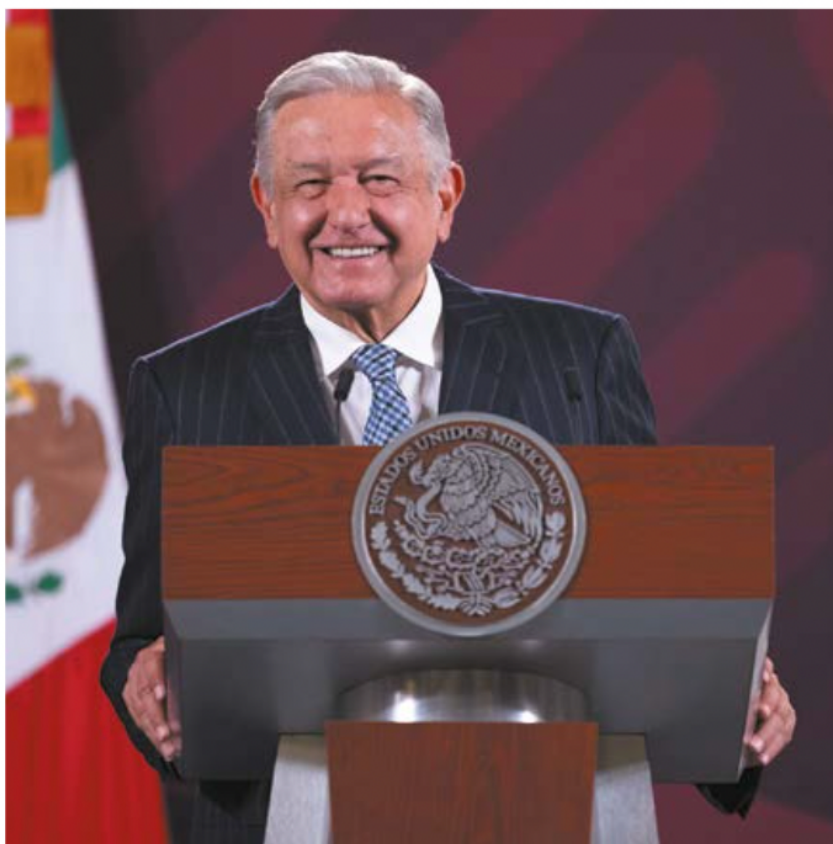
Aclaración. El presidente Andrés Manuel López Obrador, ayer, durante su conferencia de prensa.

Dice que él sólo habla “de lo importante de la transformación porque lo que existía antes era un régimen de corrupción”