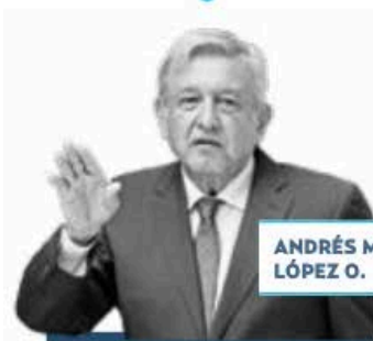
ANDRÉS M. LÓPEZ O.

» Como cuando empezó todo, en aquella campaña de 2018, será el adiós político del presidente, Andrés Manuel López Obrador . Y es que luego de las elecciones del 2 de junio, el tabasqueño anunció que realizará una "gira del adiós" por plazas públicas de los 32 entidades de la República para dar gracias a la gente por su apoyo y respaldo en los últimos 20 años, para después retirarse de la vida pública porque no desea ser líder moral ni cacique.