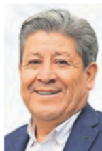
Sergio Luna Cortés

:::: La apertura de un nuevo Museo del Mamut en Tultepec ampliará la oferta cultural y científica en el Estado de México, sumándose al recinto ubicado en la zona del Aeropuerto Internacional Felipe Ángeles (AIFA). El alcalde de ese municipio, Sergio Luna Cortés , detalló que, aunque la obra ha enfrentado un retraso de aproximadamente un año, se espera que en mayo haya mayor claridad sobre su inauguración. Este espacio ofrecerá una propuesta distinta, con actividades que permitan a los visitantes conocer más sobre la riqueza paleontológica de la región y la importancia de los hallazgos en Tultepec. El desarrollo del museo estará a cargo de la Secretaría de Desarrollo Urbano Territorial. Para Tultepec, este museo no solo fortalecerá su identidad histórica, sino que también podría impulsar el turismo y la economía local.