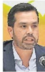
Jorge Álvarez Máynez

:::: Nos hacen ver que dentro de la contienda electoral se ha desatado una “guerra de spots”.