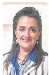
Margarita Ríos Farjat

:::: Nos cuentan que la ministra Margarita Ríos Farjat hará lo posible por reenlistar en la agenda de la Primera Sala de la Suprema Corte el caso de