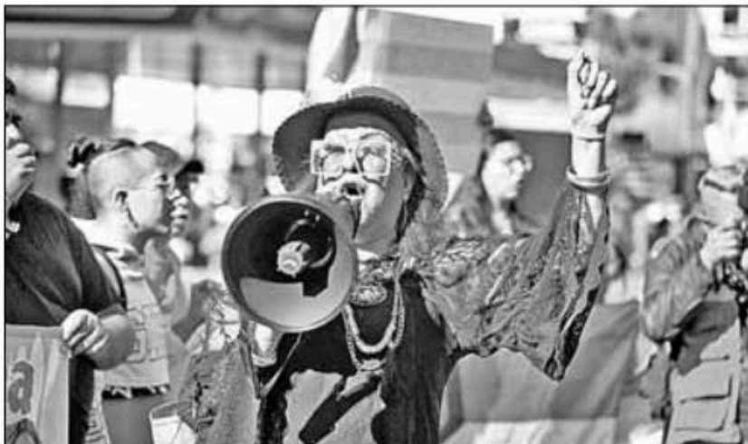
▲ Integrantes de la comunidad LGBT+ fueron a Palacio Nacional para exigir se investigue el