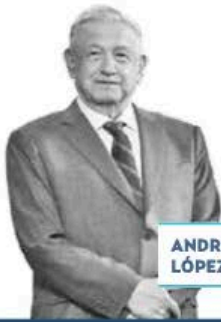
ANDRÉS M. LÓPEZ O.

► Pase lo que pase, el presidente Andrés Manuel López Obrador enviará sus proyectos de reforma al Congreso de la Unión, el 5 de febrero, con la finalidad de que diputados y senadores mantengan enfocados sus trabajos en la agenda legislativa y no en las campañas electorales. De entrada, deberán encontrar la fórmula para lograr una mayoría calificada que permita reformar la Constitución en temas judiciales, laborales y electorales.