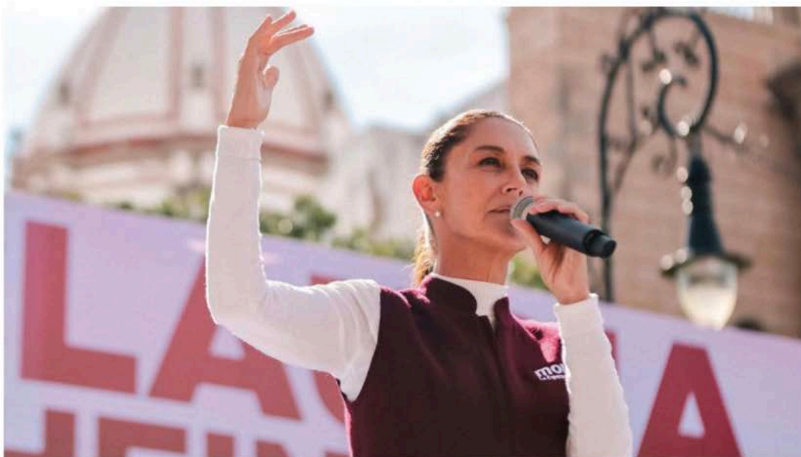
Claudia Sheinbaum tomó la ventaja inicial.

campañas todos se movieron un montón, lo que movió muy poquito, a final de cuentas, fue la intención de voto medida en las encuestas. Una carrera en la que todos han corrido a velocidad similar y han quedado a una distancia parecida. Aquí, la ventaja de inicio parece ser la clave.