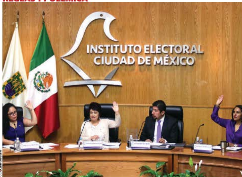
EN OCTUBRE DE 2023, luego de que el IECM anunciara los lineamientos, el GCDMX impugnó los relacionados con retiro de propaganda y blanqueamiento de bardas por imponerle una carga legal.

El periodo de precampañas dura 60 días, pero en todo este tiempo los mexicanos hemos visto propaganda política en medios audiovisuales, calles, puentes y postes de los candidatos que ya están bien definidos, con mensaje dirigido al público en general, algo muy alejado a un proceso interno.