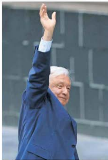
DIEGO SIMÓN SÁNCHEZ. EL UNIVERSAL

López Obrador entrega, a los historiadores, un texto que es punto de partida para analizar su paso en la vida política. La autocrítica que realiza está dirigida a los jóvenes a quienes entrega la estafeta para continuar con su programa y mantener vigente el movimiento político. Habla de su retiro de la vida pública que parece romper con la idea y los análisis que se refieren a un obradorato. Su respuesta es que