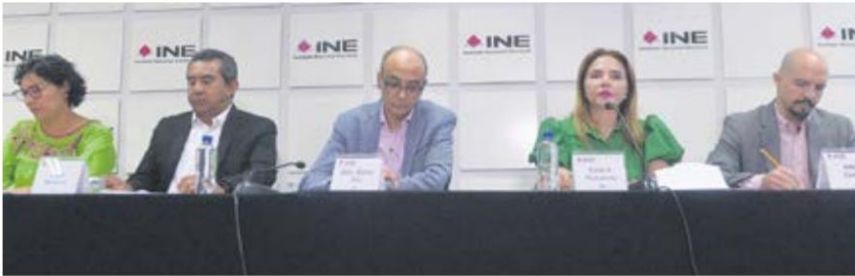
Mensaje. Consejeros del INE, ayer, en sesión.

Recordó que, en 2018, había 91 millones de personas y ahora son 98 millones, lo que implica un aumento de casillas a instalar: 170 mil.