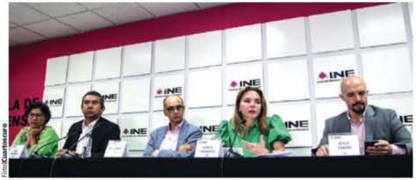
COMISIÓN TEMPORAL de Presupuesto en conferencia de prensa, ayer.

14.32 Millones de credenciales para votar se producirán