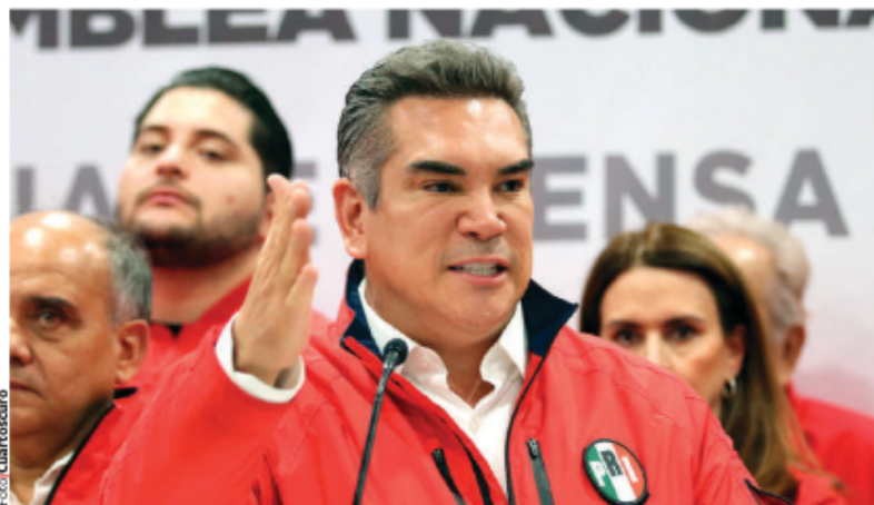
ALITO MORENO, dirigente nacional del PRI, el 8 de julio en conferencia de prensa.

COLDWELL, SAURI Y BELTRONES piden que el TEPJF suspenda el proceso iniciado en su partido; consideran inconstitucional que se pretenda realizar la renovación de la dirigencia