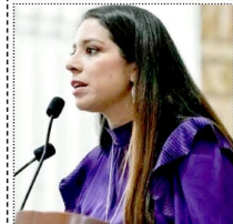
Grave denuncia de diputada Luisa Gutiérrez