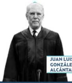
JUAN LUIS GONZÁLEZ ALCÁNTARA

► Más buenas noticias para el INAI. Luego de que el jueves la Suprema Corte de Justicia reafirmó que el Senado ha sido omiso en el nombramiento de dos comisionados del organismo de transparencia, ayer se dio a conocer que será Juan Luis González Alcántara el encargado de elaborar el nuevo dictamen. Es decir, queda en manos de uno de los ocho ministros que evitaron sobreseer el asunto, como lo proponía su compañera Loretta Ortiz .