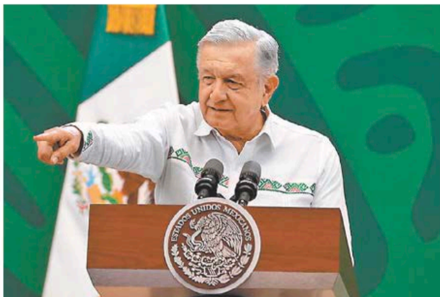
La popularidad de AMLO ha sido usada como muro de defensa. OCTAVIO HOYOS

A partir de septiembre, cuando los dos principales bloques políticos tengan sus respectivos candidatos, para efectos prácticos habrán iniciado campañas al margen del marco legal, ajenas al principio de equidad en la contienda y, por lo mismo, de la necesaria civilidad política