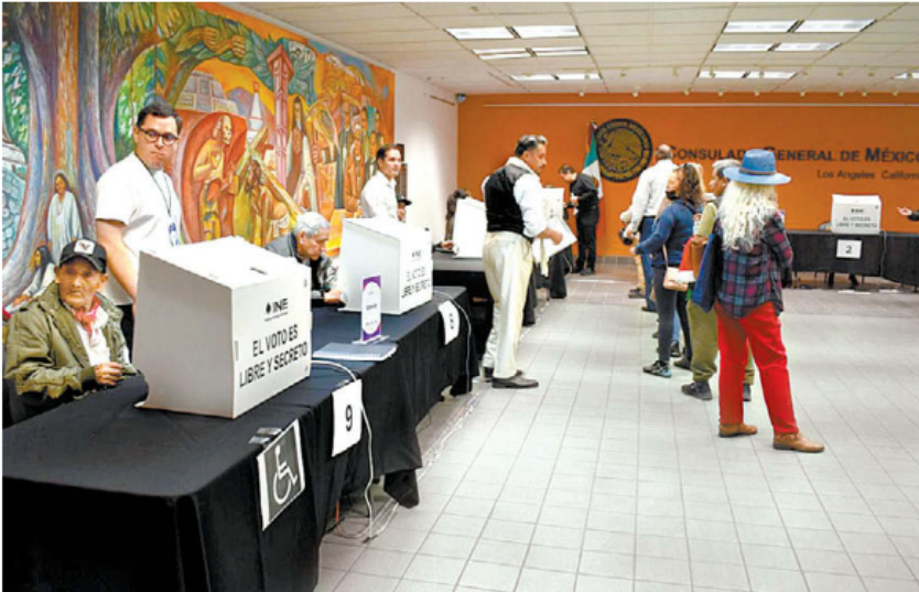
Las sedes diplomáticas solo disponían de mil 500 boletas impresas.

Aunque activistas aseguran que la logística y organización de los comicios en el exterior fracasaron, ven “un triunfo político” para los migrantes, porque salieron a demostrar que “son más que remesas”