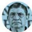
LUIS CRESCENCIO SANDOVAL

► Acción coordinada con autoridades de Belice y Honduras realizó la Secretaría de Marina, al mando de Rafael Ojeda , para interceptar una embarcación con 3.5 toneladas de cocaína, en el litoral de Quintana Roo. La lancha asegurada con la droga provenía de Colombia y se realizó un trabajo de inteligencia que culminó en su incautación.