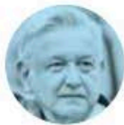
ANDRÉS M. LÓPEZ OBRADOR