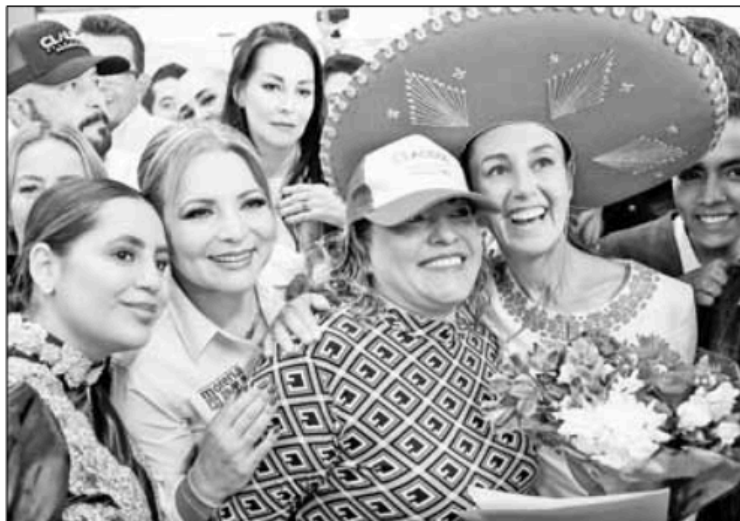
▲ Sheinbaum estuvo ayer en Tlajomulco de Zúñiga, Jalisco, acompañada por la candidata

MUCHO DEBERÁ INVESTIGARSE aún en función del video dado a conocer por autoridades capitalinas en relación con el disparo de arma de fuego contra la camioneta de Alessandra Rojo de la Vega, aspirante a presidir la alcaldía chilanga de Cuauhtémoc: tiros contra la parte trasera del vehículo, con el tirador a una cierta distancia, a menos de 24 horas de la realización de un debate... ¡Hasta mañana!