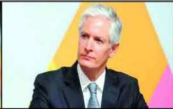
Alfredo del Mazo