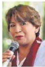
Delfina Gómez Álvarez

:::: Nos dicen que en caso de que gane la elección del próximo 4 de junio, la candidata a la gubernatura mexiquense de la alianza Morena-PT-PVEM, Delfina Gómez , ya tiene