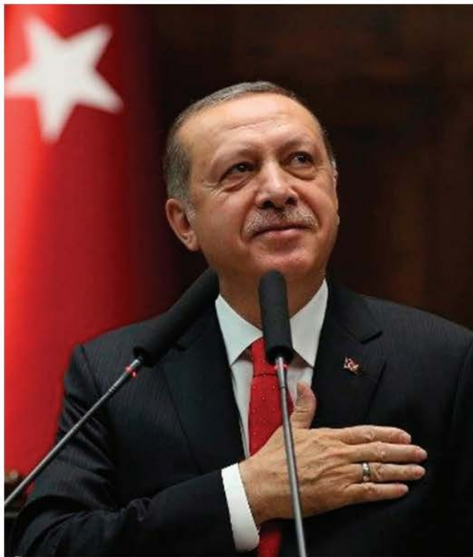
Erdogan, de 69 años, lleva dos décadas en el poder,

Aquella purga dejó al menos parte del Poder Judicial en manos de Erdogan. Un informe citado por Foreign Policy estima que 45% de los más de 21 mil jueces que hay en Turquía, tenía en 2020 tres