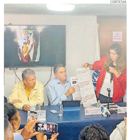
Actores políticos se unieron para hacer la denuncia

Ante ello hizo un llamado a la ciudadanía para denunciar cualquier anomalía que suceda en Toluca, pues es un hecho que sienten desesperación.