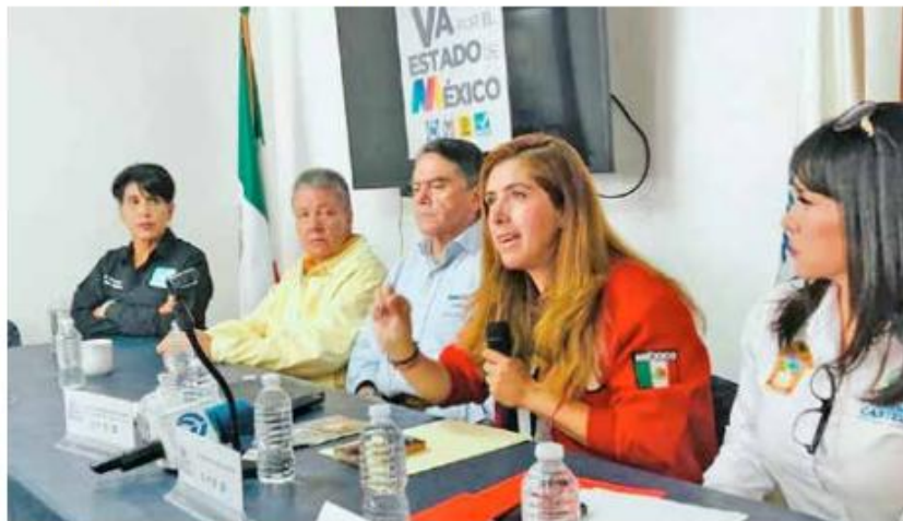
Dirigentes denunciarán ante la FGR el presunto uso de recursos públicos.