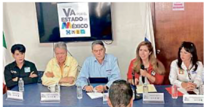
■ Diputados de la alianza Va por el Estado de México denunciaron el desvío de recursos de Veracruz al Edomex.

“Como nos instruye nuestro Gobernador Cuitláhuac García Jiménez, la fortaleza de la 4T está en sus ciudadanos, con los que transformamos a México y al Veracruz que #NosLlenaDeOrgullo”, escribió el funcionario junto a una serie de fotos.