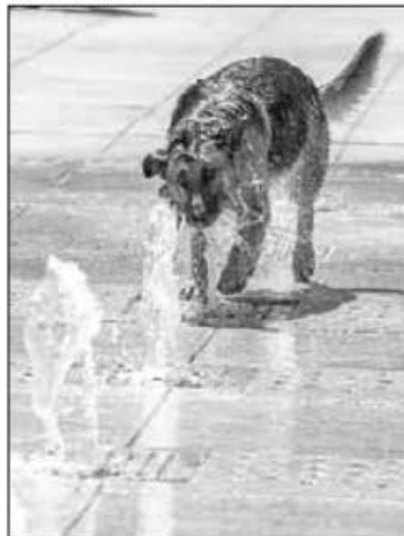
▲ Domingo caluroso en la Ciudad de México.