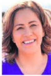
TOMADA DE X

:::: Nos dicen que la alianza opositora presentará una queja ante el Instituto Electoral de la Ciudad de México por el retiro y destrucción de propa-