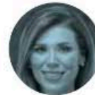
MARINA DEL PILAR ÁVILA

► Hablando de la Ciudad de México, un juez federal ordenó prisión preventiva contra el ex líder del Sindicato de Bomberos, Ismael Figueroa . La Fiscalía General de la República lo acusa de lavar 11 millones 757 mil 221 pesos, y pidió recluirlo en un penal de máxima seguridad, pero el juzgador decidió que, por lo pronto, sea internado en el Reclusorio Sur.