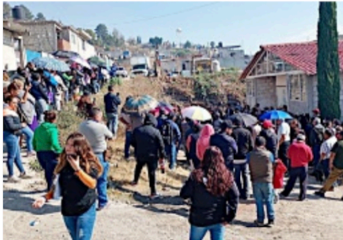
Además de reunir firmas, los colonos anexarán las identificaciones de quienes están inconformes.

puertas, ningún vecino nos ha dicho que está a favor del cambio, todos firman y dicen 'sí, yo no estoy a favor' (...), todos nos tienen la confianza de entregarnos su (copia del) INE y de firmar", aseguró.