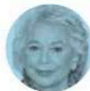
OLGA SÁNCHEZ CORDERO

► Muy activo y propositivo estuvo Samuel García , gobernador de Nuevo León, en el informe legislativo de MC. Llamó a los diputados y senadores emecistas a impulsar el "carro completo" en los comicios de 2024, con el triunfo en la Presidencia de la República, el Gobierno de la CDMX, los ocho estados en juego y el Congreso federal.