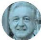
ANDRÉS M. LÓPEZ OBRADOR

› Un México feliz ve la presidenta electa, Claudia Sheinbaum , contrario a lo que dicen algunos de sus adversarios electorales, a quienes consideró representantes del pasado previo a la Cuarta Transformación. "Yo veo un México muy contento, feliz, alegre. Es más, no sólo lo veo yo, las estadísticas de felicidad que se han hecho, hoy los mexicanos y mexicanas están más contentos que hace seis años", dijo, tras recordar su triunfo en 30 de las 31 entidades del país.