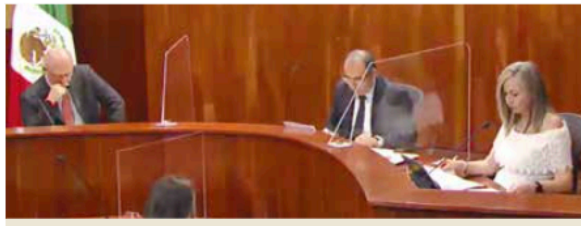
DEBATE. Integrantes de la Sala Regional Especializada, en sesión.

Xóchitl Gálvez Exaspirante presidencial (julio 2023)