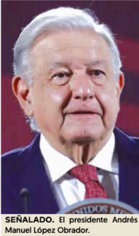
SEÑALADO. El presidente Andrés Manuel López Obrador.