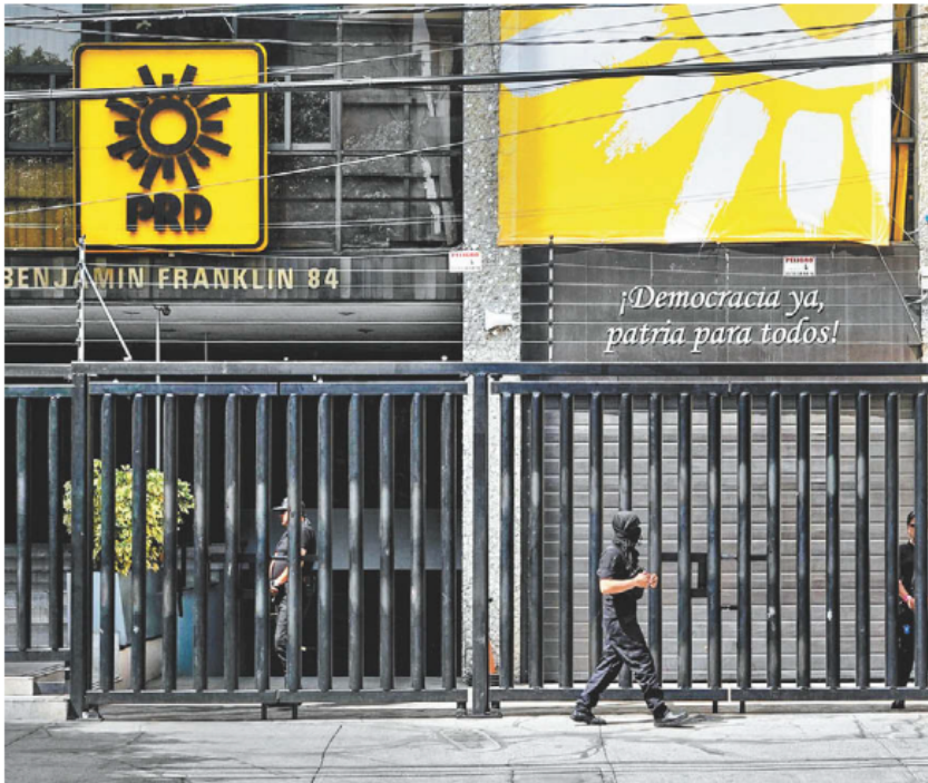
Instalaciones del organismo en la capital del país.