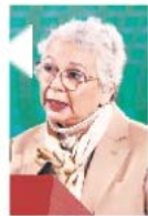
Olga Sánchez Cordero

:::: Pese a que desde Palacio Nacional se han endurecido las críticas contra los ministros de la Suprema Corte de Justicia de la Nación y se usan todos los medios oficiales para ventilar sus sueldos y