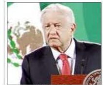
AMLO: "No olvidar lo importante que es atender las causas que originan el fenómeno migratorio"

No hay que olvidar que las autoridades estadounidenses han enfatizado que no se abrirán sus fronteras y que repatriarán o enviarán a otras naciones, en particular a México, a quienes intenten entrar como indocumentados.