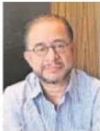
TOMADA DE TWITTER