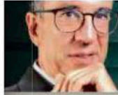
CARLOS ELIZONDO MAYER-SERRA @carlostellizondom

AMLO prometió hacer de la elección del 2024 un plebiscito constitucional. La división de poderes estará en juego.