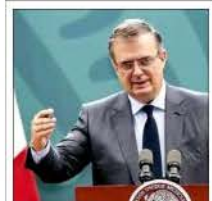
Marcelo Ebrard , informó sobre el término de las restricciones migratorias por el llamado Título 42