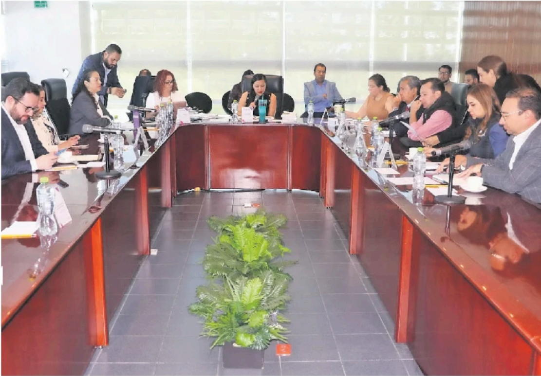
El Comité Especial de debates del IEEM sesionó ayer y determinó mantener la fecha del primer debate.