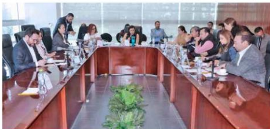
Comité Especial para la Organización de Debates del IEEM.

Dentro del documento se menciona: en atención a su oficio REPMORENA/CD/01/2023, mediante el cual se refiere que por lo que respecta al primer debate que habrá de organizar el Comité, por cuestiones de