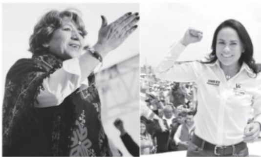
· Ambas candidatas están listas para el debate