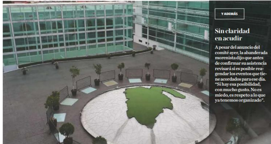
Antes de confirmar la fecha se analizó la petición de Morena. TANIA CONTRERAS

En lo referente a la definición de materiales que pueden utilizar las candidatas durante el desarrollo del debate acordaron que podrán usar cualquier tipo,