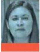
ANA LILIA RIVERA RIVERA PRESIDENTA DE LA MESA DIRECTIVA DEL SENADO @ANALILIARIVRA