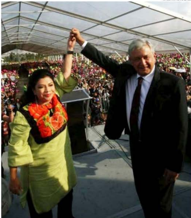
Clara Brugada y el presidente Andrés López Obrador.