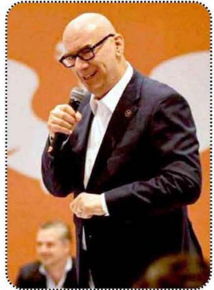
Dante Delgado Rannauro

de quien parece burlarse, porque cuando asumió el gobierno estatal juró por la Virgen morena que se quedaría los seis años completos en Nuevo León, sin distraerse en otros asuntos. No cumplió.