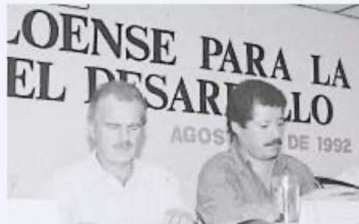
■ Luis Donaldo Colosio visitó Sinaloa, gobernada por Labastida, como Secretario de Desarrollo Social, en 1992.

"Pienso que a Luis Donaldo lo mataron las palabras