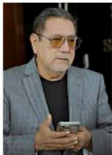
■ Félix Salgado Macedonio presidente la Comisión de Relaciones Exteriores.

la aprobación de la reforma al Poder Judicial -y luego la adscripción de la Guardia Nacional a la férula de la Defensa Nacional- fue el todavía panista Miguel Ángel Yunes Márquez, quien fue premiado con sendas secretarías en la Comisión de Energía y en la de Justicia, dos de las más importantes.