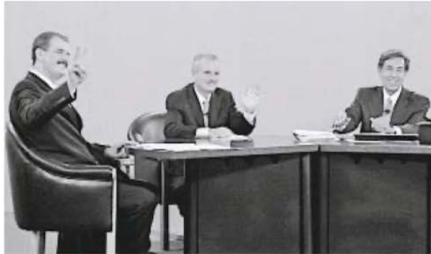
■ En el debate presidencial de 2000, con Vicente Fox y Cuahtémoc Cárdenas.

¿Es Sinaloa un narcoestado? Ahorita tiene un narcogobierno ■