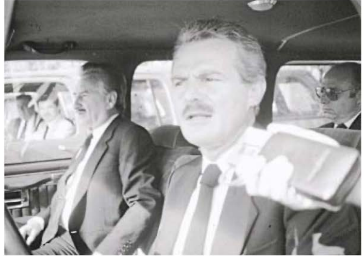
■ Con el entonces Secretario de Gobernación, Fernando Gutiérrez Barrios, en 1989, cuando Labastida era Gobernador de Sinaloa.

¿Esta estrategia del Gobierno federal de enviar