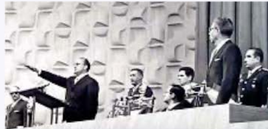
■ Luis Echeverría rinde protesta como Presidente, ante la mirada de Díaz Ordaz.

"Detrás de todo eso estaba don Luis, su finalidad era provocar un clima de inestabilidad social y política que