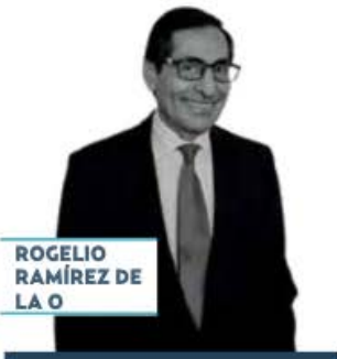
ROGELIO RAMÍREZ DE LA O

› Nos dicen que el secretario de Hacienda, Rogelio Ramírez de la O , anduvo en New York. Allí se reunió por separado con los CEO de JPMorgan Chase, Jamie Dimon ; y de BlackRock, Larry Fink . Estos encuentros se dieron días antes de que el secretario de Economía, Marcelo Ebrard , encabezara una cumbre con empresarios de EU para explicarles el plan del gobierno de la presidenta Claudia Sheinbaum , y hacerles ver que la Reforma Judicial no pondrá en riesgo sus inversiones.