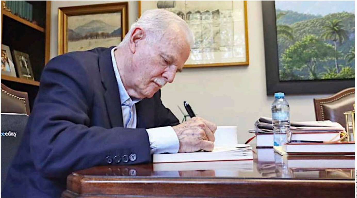
■ Francisco Labastida hace un balance de su vida política en su libro La duda sistemática .