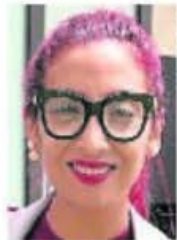
TOMADA DE X