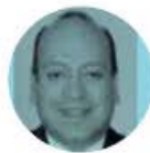
JULIO CÉSAR MORENO

› Este domingo, la Comisión de Justicia de la Cámara de Diputados prevé aprobar el dictamen de las leyes secundarias de la Reforma Judicial. El organismo, que preside el diputado de Morena Julio César Moreno , debe entregar el documento para que el lunes se suba al pleno y se vote, con lo que se consumirían los trabajos legislativos en ese tema.