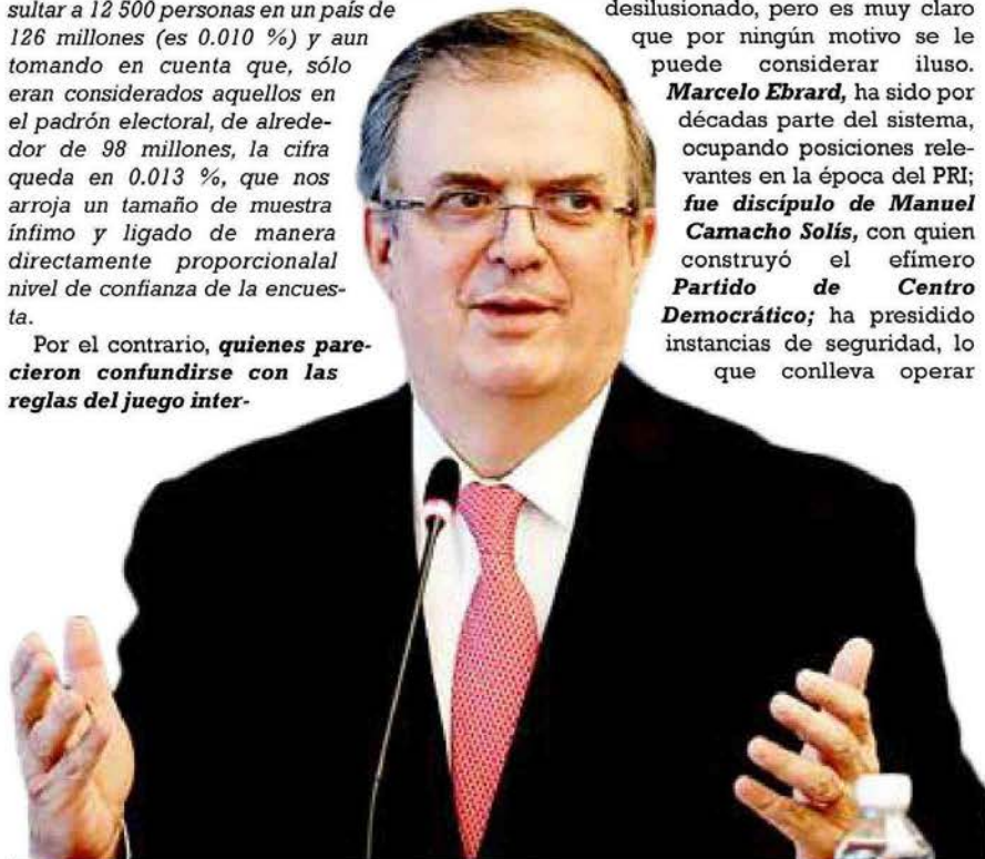
Marcelo Ebrard Casaubon

Entretanto, México madura democráticamente y avanza por la vía progresista de un camino de siete décadas que pasó del reconocimiento constitucional del derecho al voto de la mujer, a la posibilidad real de que una mujer sea votada como Presidenta de la República. Y en esa misma ruta, se acelera la actividad política en los procesos de sucesión en la Ciudad de México, Chiapas, Guanajuato, Jalisco, Morelos, Puebla, Tabasco, Veracruz y Yucatán; donde sujetos a la paridad de género, comienzan a tomar delantera las y los aspirantes que sin tibieza, durante el proceso interno, abiertamente hicieron propio, replicaron el sentir del " Movimiento " y pronunciaron: Es Claudia.