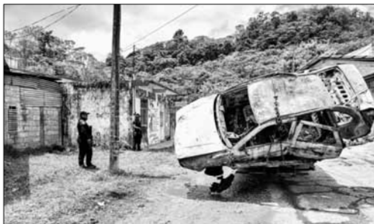
▲ Policías observan vehículos quemados por grupos armados que han generado una ola de violencia en Tila, Chiapas, obligando a sus habitantes a abandonar la ciudad. Ayer, ejidatarios de la zona señalaron en un