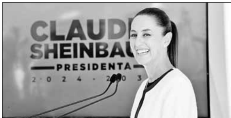
▲ La virtual presidenta electa, Claudia Sheinbaum, ofreció ayer una conferencia de prensa en la que reiteró que “no hay nerviosismo”, pues la economía “está muy