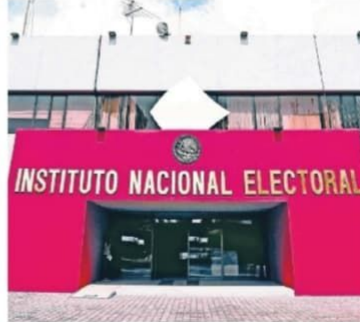
La información de los adeudos está contenida en la plataforma de Sanciones y Remanentes del Instituto Nacional Electoral.