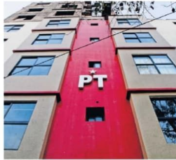
El Partido del Trabajo (PT) encabeza la lista de deudores con un saldo pendiente que asciende a 127 millones 77 mil 922 pesos.